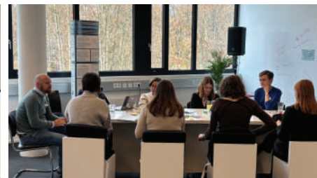
An offenen Thementischen wurde vieles diskutiert.